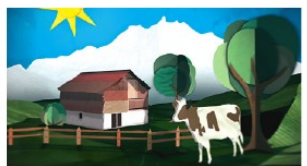
Frühe Anfänge, für die Agentur Jung von Matt.