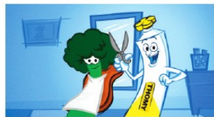
Thomy lebt dank Addictive und 3D.