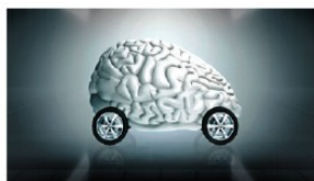
Schon ein paar Jahre zurück: Smarte Idee von Jung von Matt zusammen mit Boutiq.