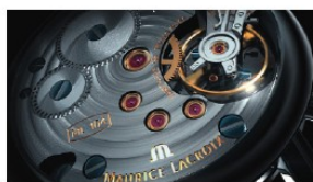
Maurice Lacroix für den Producer Condor.