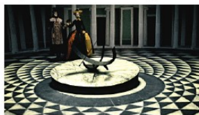
Blush Films mit Victorinox.