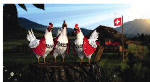
«Jodeln». Kunde: Bell; Agentur: Blue Spirit; Filmproduktion: Condor.

Inzwischen sind beim Zürcher Hot-Shop bereits neun Spezialisten fulltime beschäftigt. Die Kernkompetenz des Studios ist die Verbindung von Film und Animation – gute Geschichten auf eine kreative Art zu erzählen, bei der Live-Action mit den neuesten Trends der Computergrafik kombiniert werden. Das Team bei Boutiq besteht aus Designern bzw. Animatoren aus dem In- und Ausland, deren Liebe zu Storytelling und Grafik in einer breiten gestalterischen Vielfalt resultiert. So konnten in den vier Jahren seit der Gründung der Firma bereits zahlreiche Spots für namhafte Brands kreiert werden. Die Herausforderung ist dabei, in enger Zusammenarbeit mit der Agentur möglichst neue und eigenständige Looks zu kreieren, die die Aussage der Filme unterstützen. Andreas Panzeri