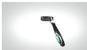
Einfach, aber genial für BMW.