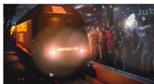
Das neueste Millionenlos für Blue Spirit mit Plan B Film.