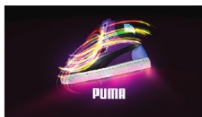
Mindestens drei Monate Arbeit am Computer für diesen Schuh von Puma.