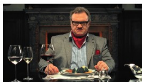
Trick und Realität für Spar und Addictive Productions.