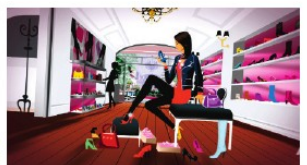
Der Trick mit dem Gewinn: Swisslos, Boutiq und Bluespirit.