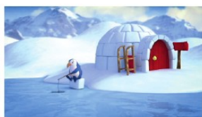
Homegate für Hesskiss.