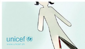
Stilvoll: Mädchenbescheidung für Playground.